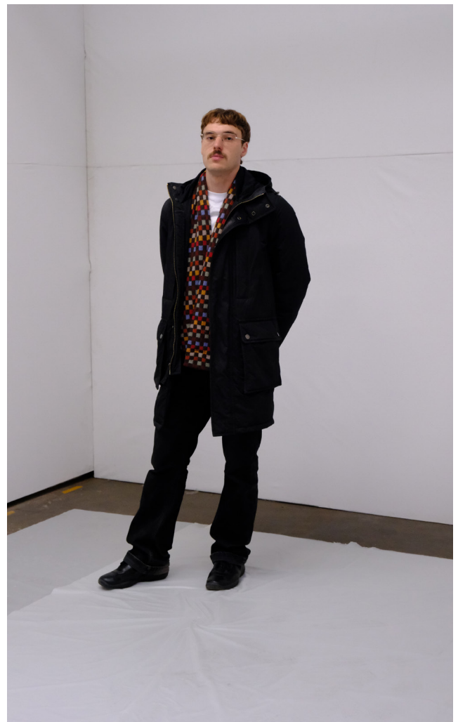
Pablo Normand © Mahaut Azéma

Muts de Marguerite Li-Garrigue explore les notions de mutation et de transformation à travers des sculptures inspirées des stades de métamorphose des insectes. Nourri par l'entomologie, la sociologie et des expériences humaines, ce projet, développé avec Transfo, établit un parallèle entre développement biologique et évolution des individus ou des sociétés, révélant leurs analogies et fragilités.