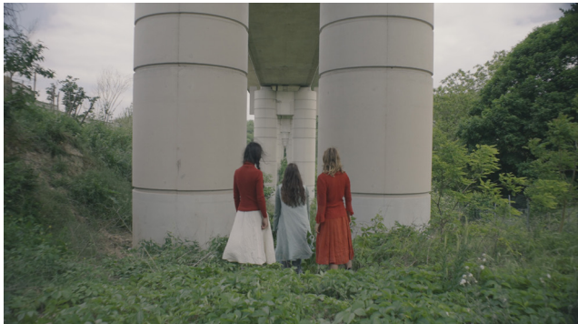
L'écoute des sols