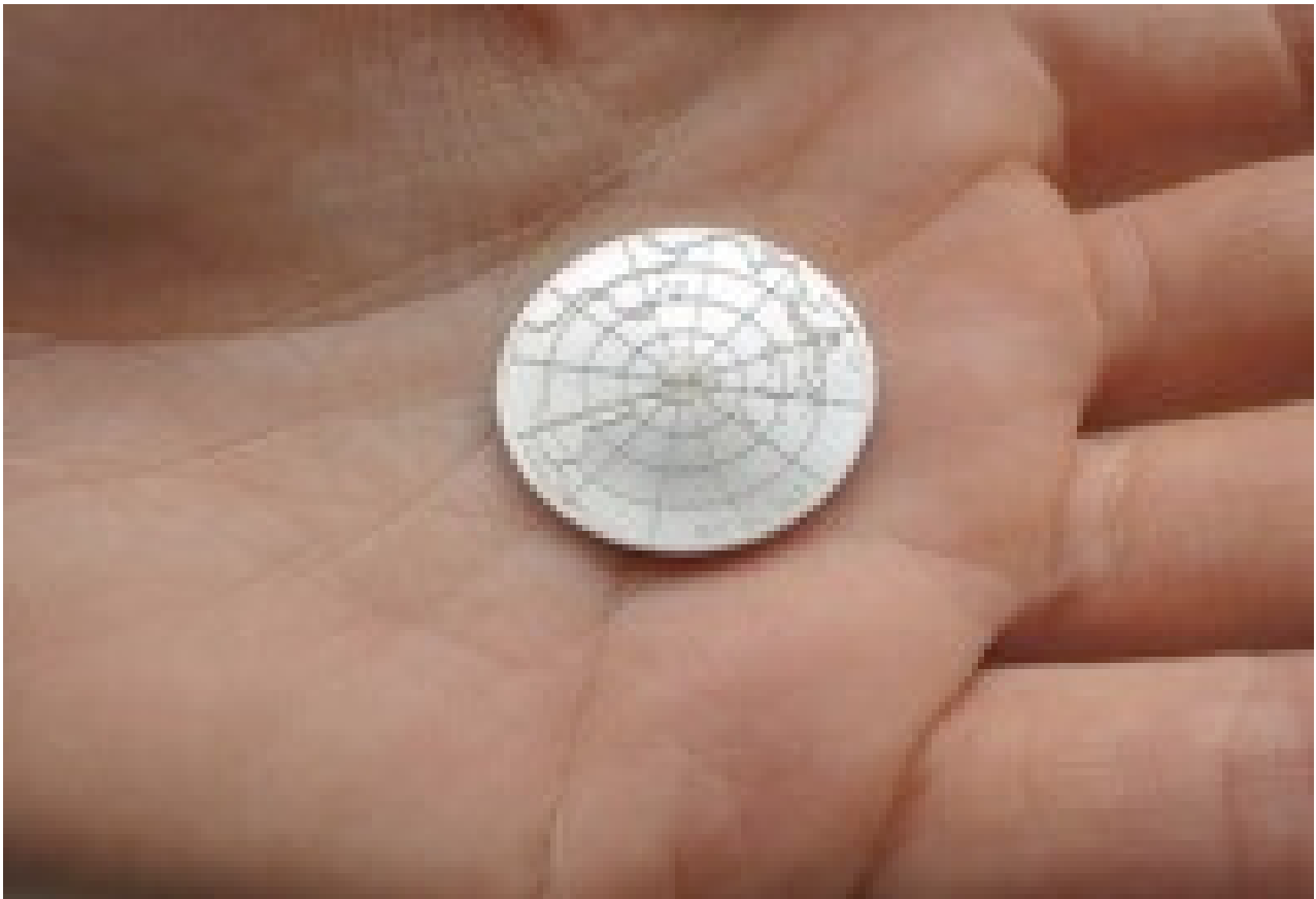
Pile ou face, 2014 Pièce de monnaie en argent gravée, coffret Diamètre : 2,4 cm