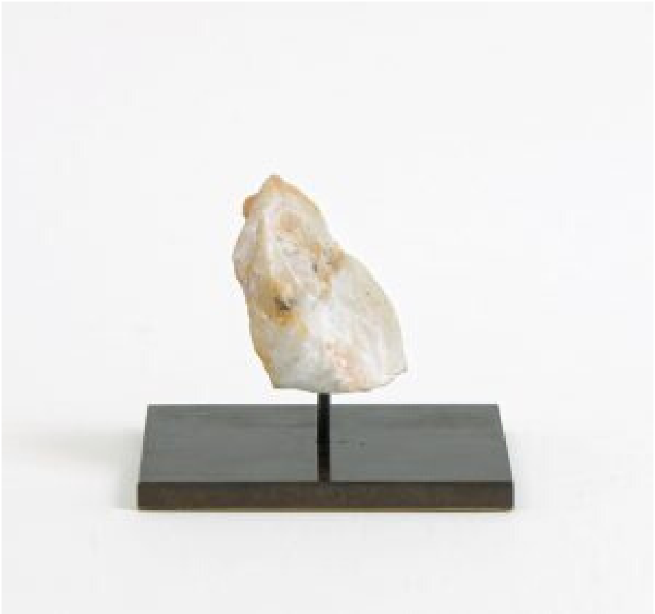
Tyrannosaurus rex, 2015 Taille directe sur grès rose Dimensions: 4,8 x 4,8 x 3,8 cm