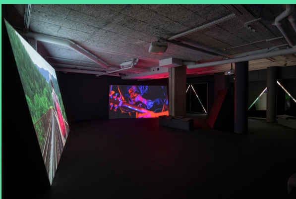
Vue de l'exposition Ben Russell, La montagne invisible , frac île-de-france, le plateau, 2020. Photo Martin Argyroglo © Ben Russell

Ce jouet d'optique s'inspire de l'exposition La montagne invisible , présentée au Plateau depuis le mois de janvier par l'artiste et cinéaste américain Ben Russell. S'inspirant du récit d'exploration fantastique Le Mont Analogue , de René Daumal, La montagne invisible retrace le voyage de Ben et de son ami Tuomo de la Finlande à la Grèce. Via des multiples projections audiovisuelles, des surfaces de couleur vibrante, des signes graphiques en miroir et des effets d'illusion, cette exposition nous invite à explorer la frontière entre réalité et perception.