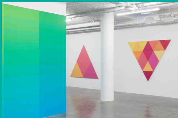
Vue de l'exposition Stéphane Dafflon - U+25A6, frac île-de-france, le plateau, 2018. Photo Martin Argyroglo © Stéphane Dafflon

Cet atelier s'inspire de l'exposition monographique de l'artiste suisse Stéphane Dafflon, « U+25A6 », présentée au Plateau en 2018. Créé à l'écran tout d'abord puis transposé de l'ordinateur à la toile ou au mur, le travail pictural de Stéphane Dafflon est toujours pensé pour une architecture bien précise, dans laquelle il s'inscrit et sur laquelle il va agir pour modifier la perception qu'en a le spectateur. L'artiste réalise ses toiles géométriques abstraites avec la technique du masquage, qui permet de superposer des aplats de peinture uniformes pour obtenir des contours très nets.