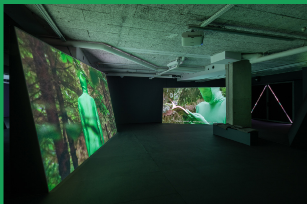
Vue de l'exposition Ben Russell, La montagne invisible , frac île-de-france, le plateau, 2020. Photo Martin Argyroglo © Ben Russell

La fabrication de ce jouet optique s'inspire de l'exposition La montagne invisible , présentée au plateau de janvier à juillet 2020 par l'artiste et cinéaste américain Ben Russell. S'inspirant du récit d'exploration fantastique Le Mont Analogue , de René Daumal, La montagne invisible retrace le voyage de Ben et de son ami Tuomo de la Finlande à la Grèce. Via des multiples projections audiovisuelles, des surfaces de couleur vibrante, des signes graphiques en miroir et des effets d'illusion, cette exposition nous invite à explorer la frontière entre réalité et perception.