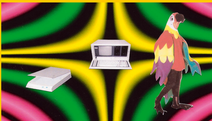
Chill Out: Mister Collage, 2007, collection Frac Île-de-France. Dessin, Collage. Dimensions : 21 x 29,7 cm

Dispose puis colle les éléments découpés sur ton fond coloré.