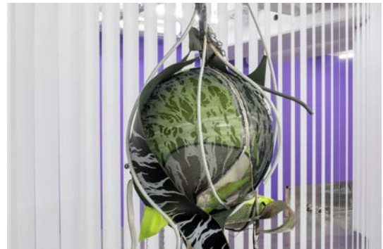
Vue d'exposition O' Ti' Lulaby , David Douard avec O' T (Kappa) , 2020 (détail). frac île-de-france, le plateau.