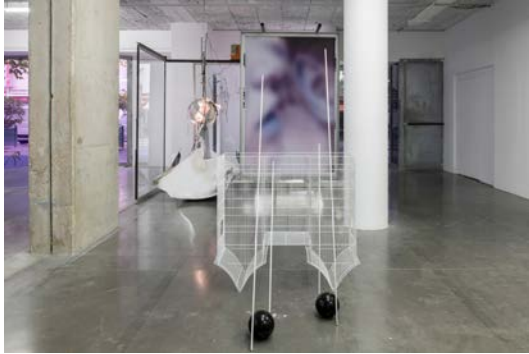
Vue d'exposition O' Ti' Lulaby , David Douard, avec au 1er plan Meal (N' Shit) Canary Feel It 2 , 2020. frac île-de-france, le plateau.