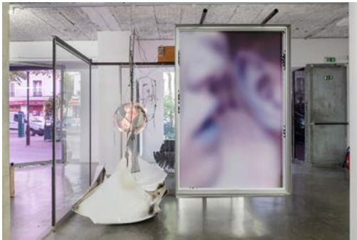
Vue d'exposition O'Ti' Lulaby , David Douard, avec Untitled Mélodie 1 , 2020 et O'T (Maladjusted) , 2020. frac île-de-france, le plateau.