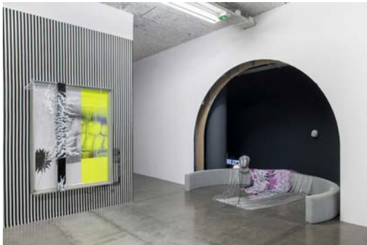
Vue d'exposition O' Ti' Lulaby , David Douard, avec EU'R 3 , 2020 et Cortex OU Light 3 , 2020 frac île-de-france, le plateau.