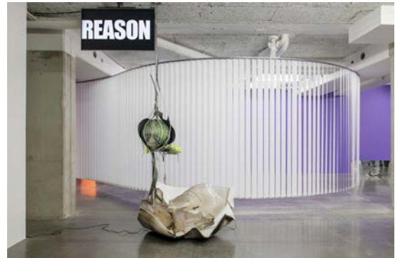
Vue d'exposition O'Ti' Lulaby , David Douard, avec au 1er plan O'T (Kappa) , 2020. frac île-de-france, le plateau.