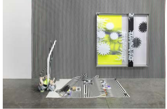
Vue d'exposition O' Ti' Lulaby , David Douard, avec Cortex OU Light 2 , 2020 et EU'R 2 , 2020. frac île-de-france, le plateau.