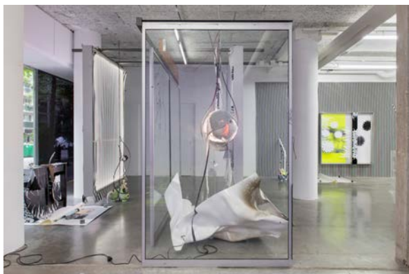
Vue d'exposition O'Ti' Lulaby , David Douard, avec au 1er plan O'T (Maladjusted) , 2020. frac île-de-france, le plateau.