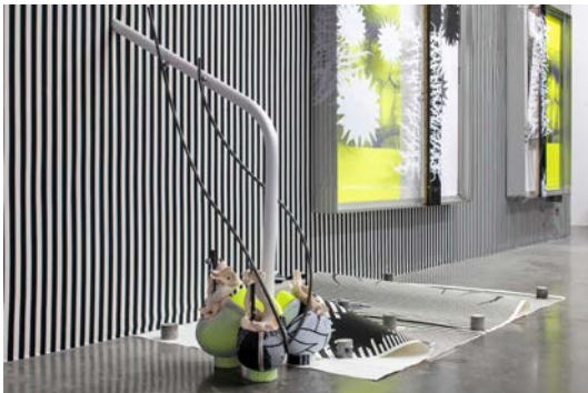
Vue d'exposition O' Ti' Lulaby , David Douard, avec au 1er plan Cortex OU Light 2 , 2020 frac île-de-france, le plateau.