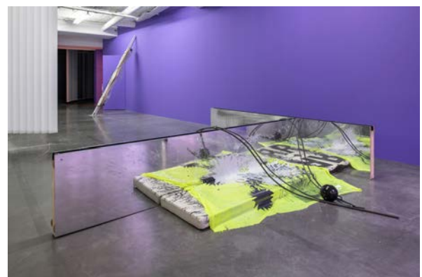
Vue d'exposition O'Ti' Lulaby , David Douard, avec au 1er plan Us / They , 2020. frac île-de-france, le plateau.