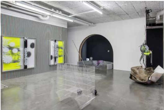
Vue d'exposition O'Ti' Lulaby , David Douard, frac île-de-france, le plateau (2020).