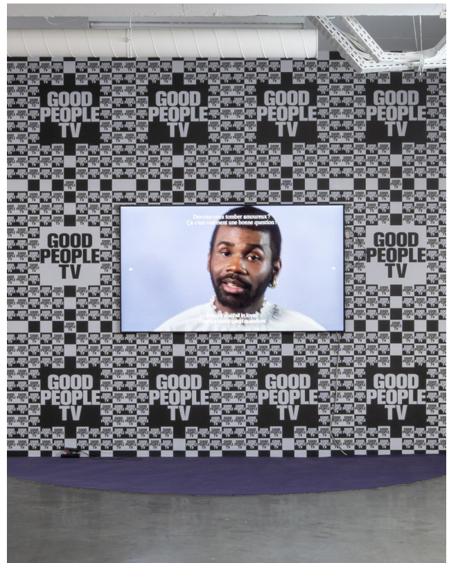
Vue de l'exposition A Change of Perspective , Ndayé Kouagou, Le Plateau, Paris

À partir de l'univers de Ndayé Kouagou, les élèves imaginent des costumes conçus à partir de différents tissus préalablement classés par typologie incarnant une humeur, une personnalité. Ils réalisent ensuite le patron dans l'esprit de leur marque préférée.