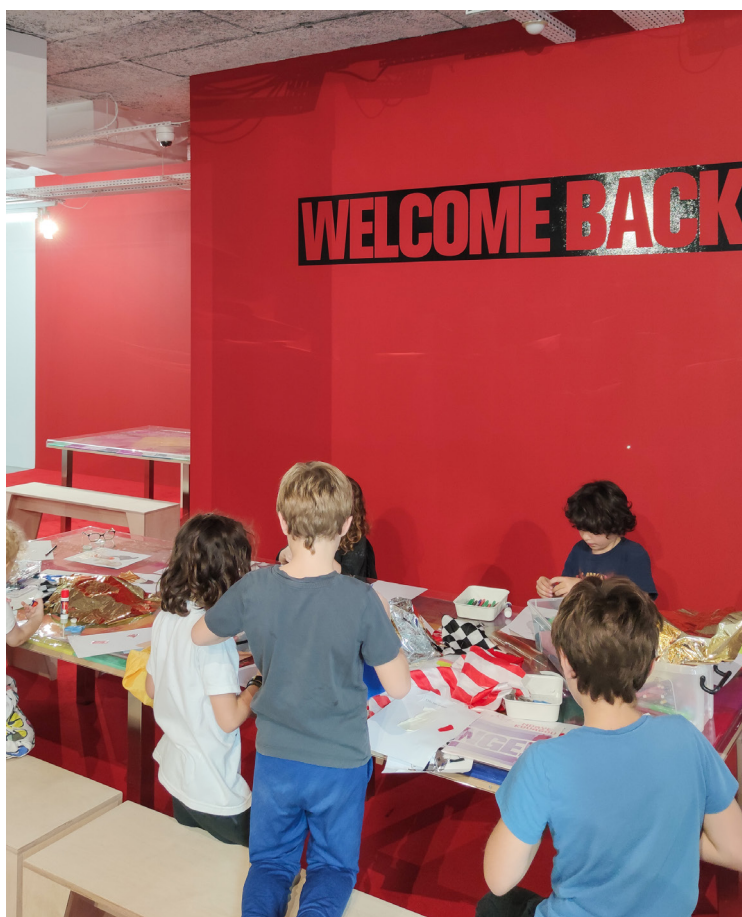
Vue de l'exposition A Change of Perspective , Ndayé Kouagou, Le Plateau, Paris

Un nouvel espace de pratique libre a pris place dans l'accueil du Plateau. L'artiste a souhaité l'intégrer à son parcours d'exposition et en faire une œuvre participative. L'exposition s'ouvre et se ferme ainsi sur une aire d'activité pour tous et toutes, où s'exposera un jeu de questions-réponses reflétant la palette de doutes que génère l'injonction à l'évaluation permanente.