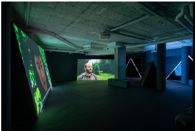
Vue de l'exposition Ben Russell, La montagne invisible , Frac Île-de-France, Le Plateau, Paris, 2020. Photo Martin Argyroglo © Ben Russell