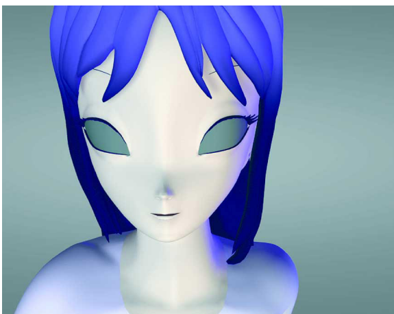
Pierre Huyghe & Philippe Parreno - No Ghost Just a Shell, 2000