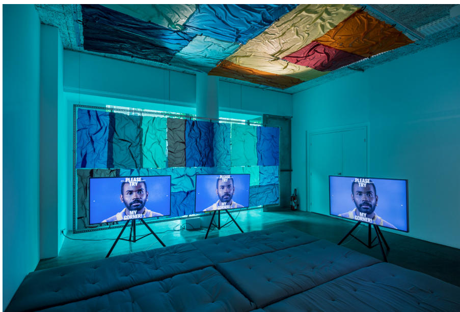
Vue de l'exposition A Change of Perspective , Ndayé Kouagou, Le Plateau, Paris

Les différentes pratiques de Ndayé Kouagou s'articulent autour du langage sans qu'il n'établisse de hiérarchie entre elles. De la matérialité du tableau, aux vidéos évoquant l'univers des influenceurs, à celles intimes et éphémères des performances ou des workshops , son œuvre considère au même niveau la transmission via l'objet que via la performance ou le format pédagogique.